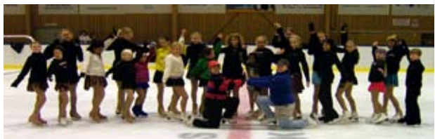
Bollnäs Konståkningsklubb på läger i Älvdalen

Älvdalen Hockey välkomnar ishockeyungdomar till Älvdalen. Om intresse finns och tidschemat tillåter spelar vi gärna träningsmatcher mot gästande lag. Älvdalen Hockey ställer normalt upp med flera ungdomslag i seriespel från 9/10 års ålder till 15/16 samt juniorer. För mer information vänligen kontakta Älvdalen Hockey.